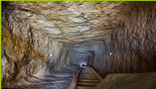
Blick in einen mittelalterlichen Tagesschacht

Deshalb realisierte der Förderverein in Zusammenarbeit mit dem Landesamt für Archäologie Sachsen und mit Hilfe zahlreicher Unterstützer aus dem privaten, wirtschaftlichen und gesellschaftlichen Bereich einen Bergbaulehrpfad zum mittelalterlichen Bergbau.