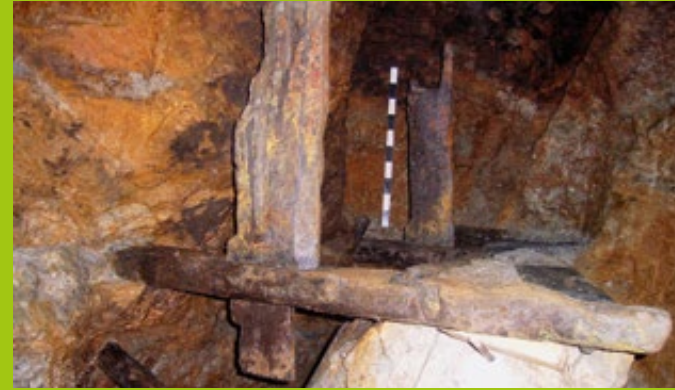
Eine fast vollständig erhaltene Haspel aus den Bergwerken unterhalb des Obertorplatzes