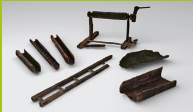
Fotorealistische 3D-Scans mittelalterlicher Holzeinbauten aus Dippoldiswalde