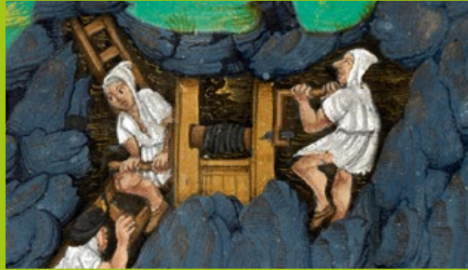
Szenische Darstellung zweier Haspelknechte in dem Kuttenberger Graduale (15. Jh.) (Österreichische Nationalbibliothek Wien)