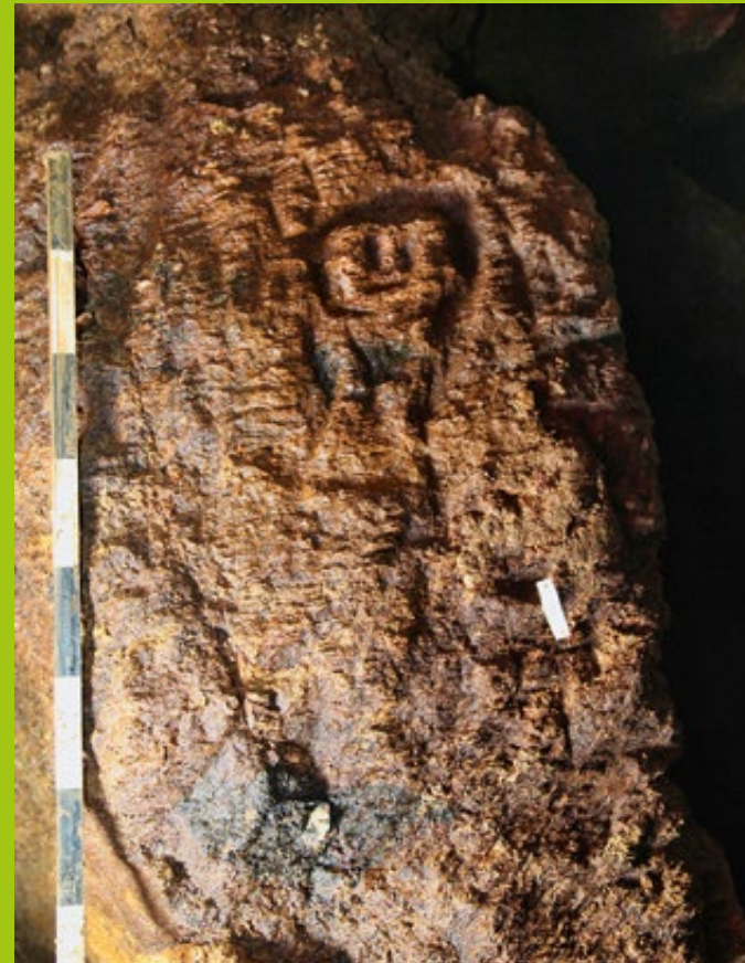
Relief einer menschlichen Figur unterhalb der Pension Göhler, Glashütter Straße 3